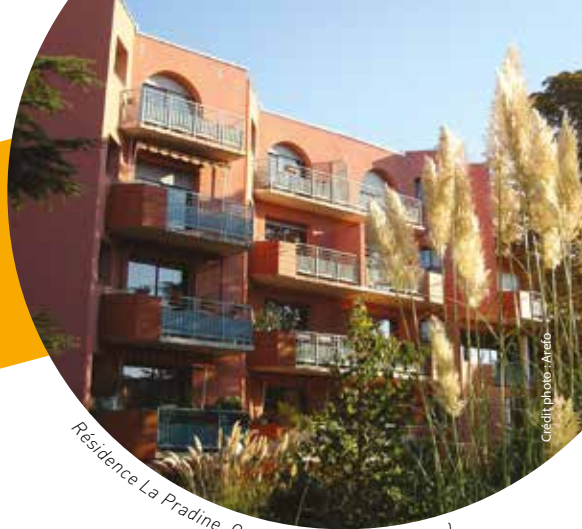
Résidence La Pradine, Colomiers (Haute-Garonne)

"Être chez soi tout en gardant un espace collectif"