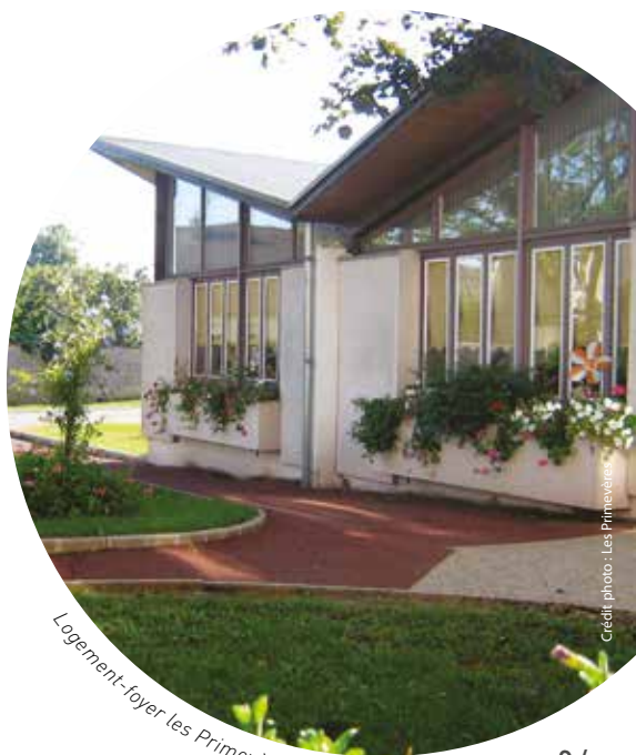
Logement-foyer Les Primevères, Beaune (Côte-d'Or)