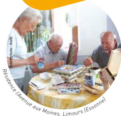
Résidence L'Avenue aux Moines, Limours (Essonne)